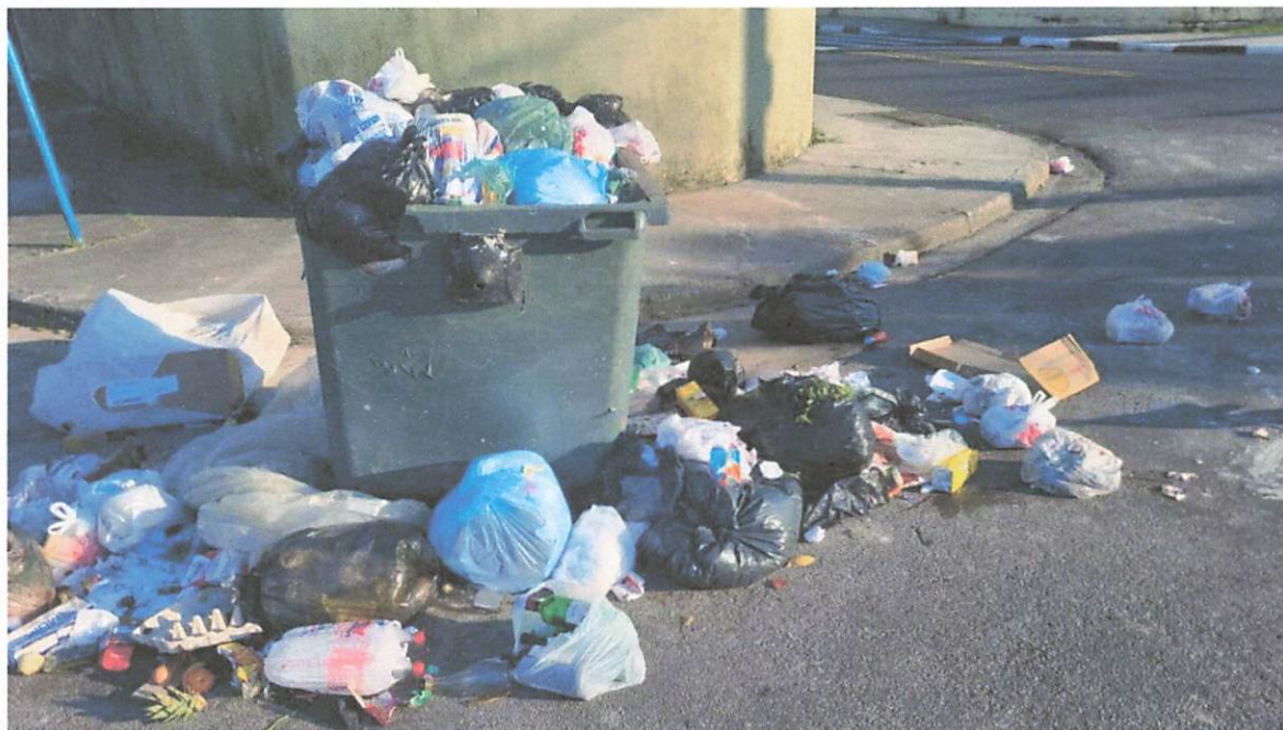
Figura 1 CENTRO DE BERTIOGA