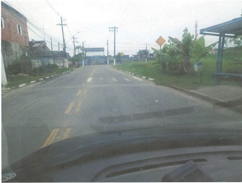
Faixa de Pedestre APAGADA em frente ao condomínio Nedda Goulart