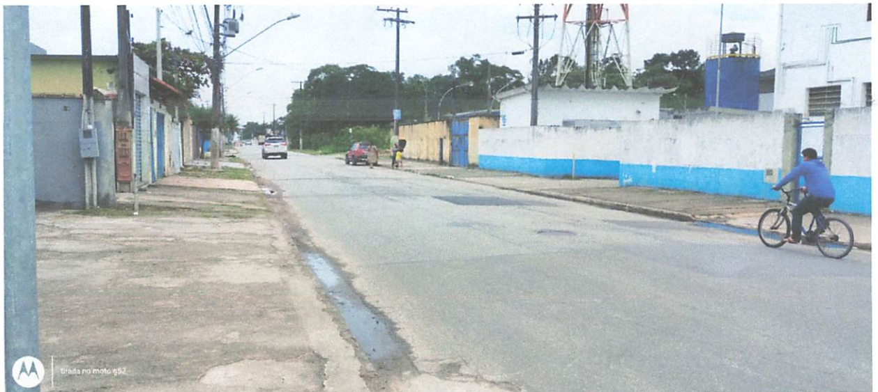
Faixa de Pedestre APAGADA em frente a Sabesp/Indaiá