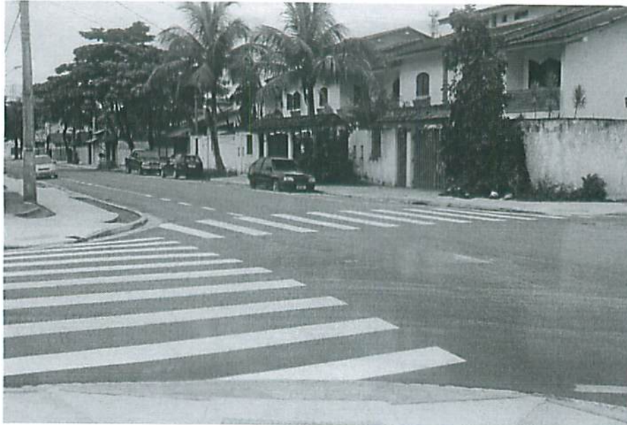
Esquina da rua Dr Hugo Santos Silva / Rua Dr Amador Aguiar , no entorno da praça Potengi, bairro Maitinga.