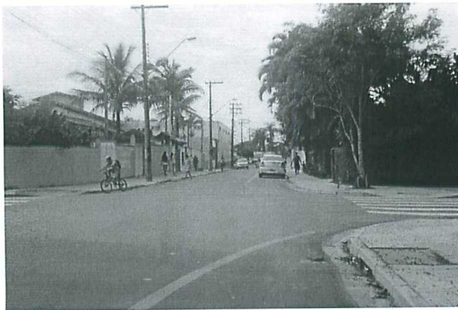
Rua Oswaldo Cruz, esquina com a rua Afonso pena, bairro Centro.