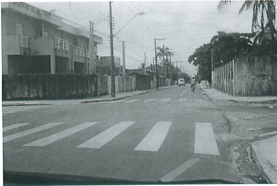
Rua Oswaldo Cruz, esquina com, rua Braz cubas, bairro centro.