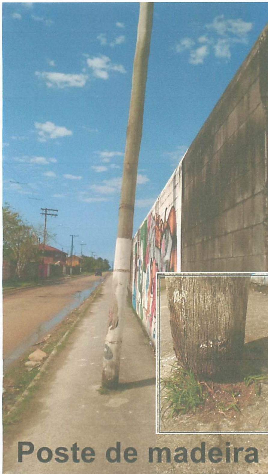
Poste de madeira