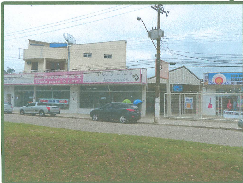
Avenida Anchieta em frente a Loja "Sonomar"