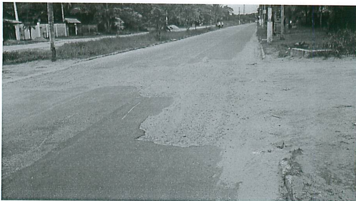
Foto – Av. Anchieta esq. Rua Oscar Martins Pinheiro