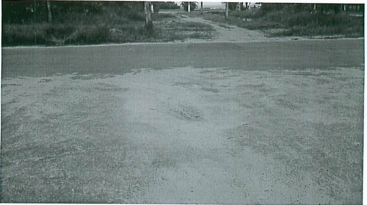
Foto – Av. do Telégrafo esq. Av. Lucas da Cruz Carvalho