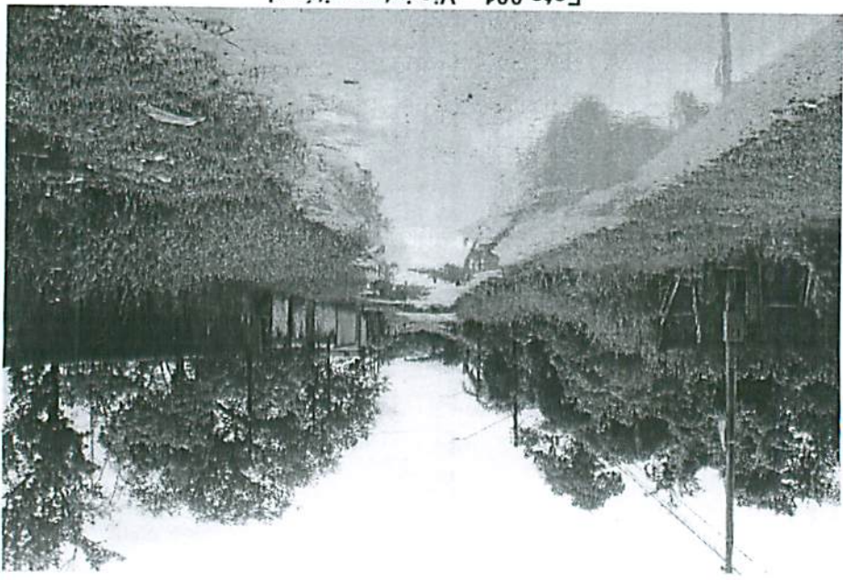
Foto 001 - Via intransitável