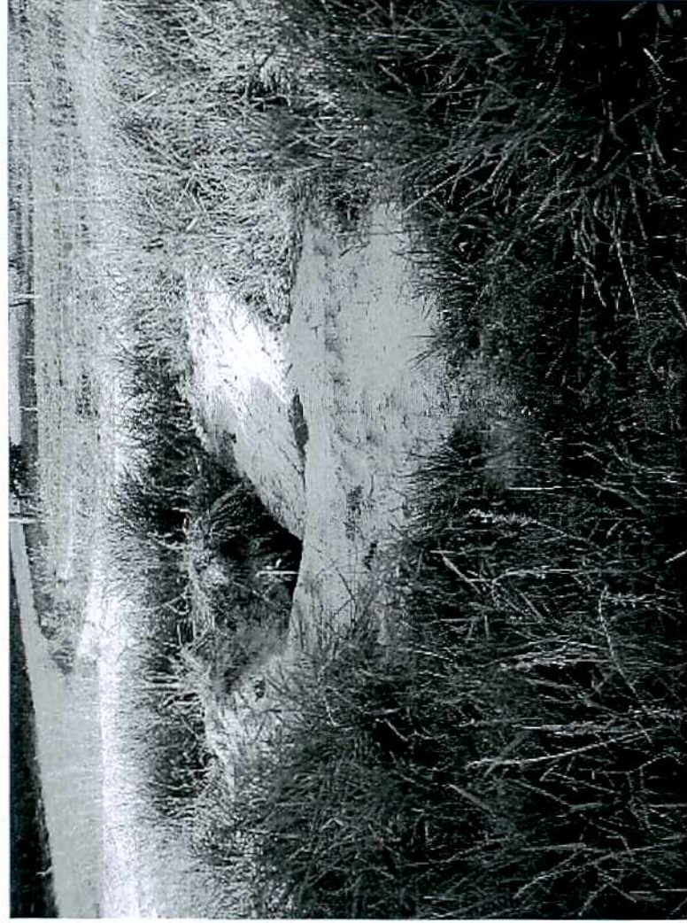
Foto 002: demonstra a proximidade do buraco com o leito carroçável