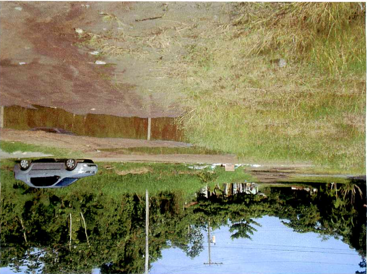
Rua Sabino Abdala