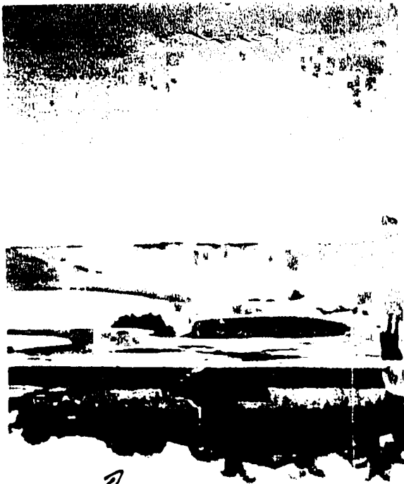
Escola Municipal José de Oliveira