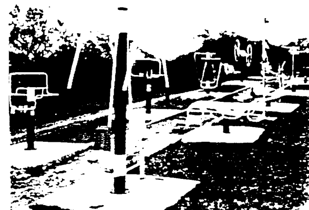
Santo Antônio da Patrulha /RS