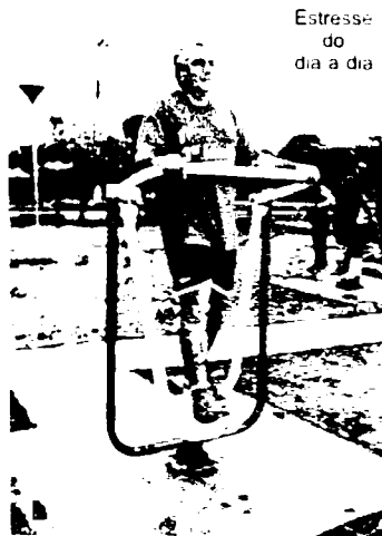
Estresse do dia a dia

A Academia ao Ar Livre possibilita que pessoas sedentárias, ou que nunca praticaram nenhuma atividade física, após visitar o Espaço, empolguem-se e comecem a praticar exercícios diariamente. A Academia ao Ar Livre oferece um excelente visual, unindo o útil ao agradável, tornando-se um estímulo ao Turismo, uma oportunidade para os visitantes praticarem suas atividades físicas enquanto observam as belezas características da cidade.