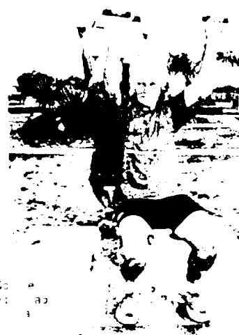
Calor e umidade