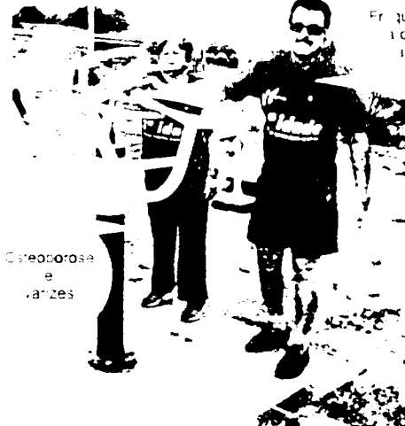
Osteoporose e artrites