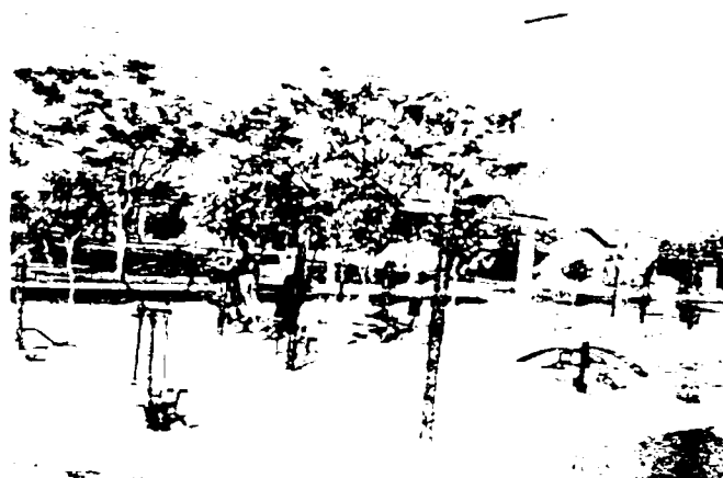
São João de Iracema /SP