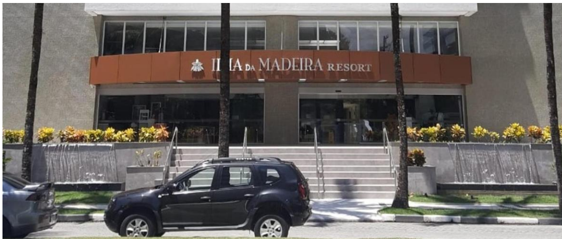
Item Inventariado 7. Ilha da Madeira Resort