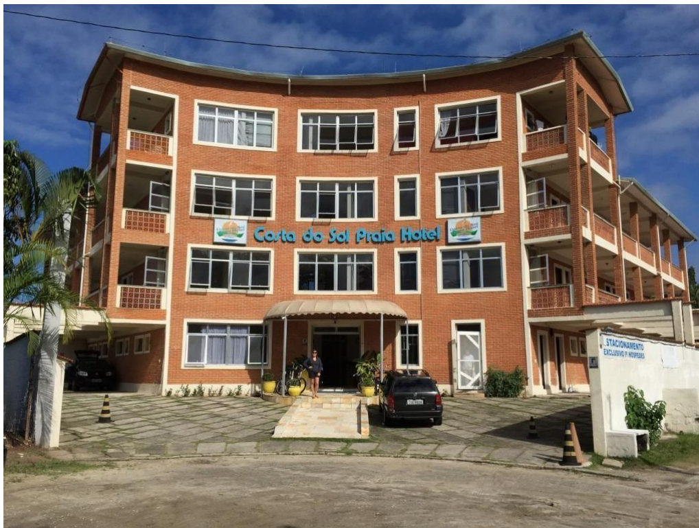
ITEM INVENTARIADO 6. COSTA DO SOL PRAIA HOTEL