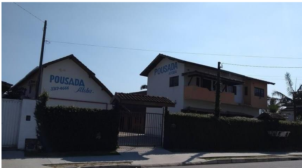
Figura 57. Pousada Atobá